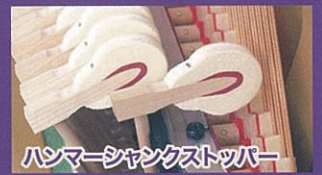
ハンマーシャングストッパー

演奏者の素早い指の動き、細かなニュアンスをとらえるキーセンサーを搭載。鍵盤の浅い位置でのトリルや連打も違和感なく演奏できます。