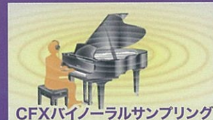
CFXバイノーラルサンプリング

連携アプリなら音色の選択、メトロノーム、楽器演奏の録音操作などもデバイス上で簡単におこなえます。