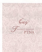
指導者パスポート